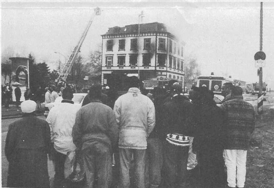
Lübeck, 18. 1. 1996