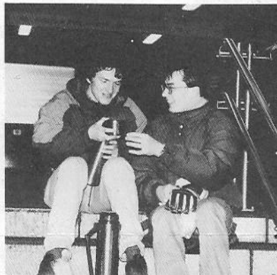
... um Getränke (aus-) zu-teilen

Ich antworte: "Genau deshalb.". Mir gefällt der Slogan, ja, genau das ist es, warum wir da sind. "Verschafft Recht den Unterdrückten, verheißt den Gebeugten und Armen zum Recht", sagt Psalm 82, und das zieht sich durch die ganze Bibel. Wir sind nicht nur gekommen, um Schlafsäcke, Tee und Kaffee zu verteilen, nein, uns geht es um mehr. Der